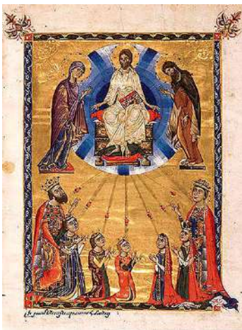
Թորոս Ռոսլին «Կեռան թագուհու Ավետարանի»

1272թ. գրված և նկարագրողված <<Կեռան թագուհու Ավետարանի>> մարդկանց իրանները կարծես ավելի են ձգված հագուստների նրբագեղ ոսկե ծալքագծերի պատճառով: Տեսարանները հասցված են մեծ հուզականության: Եվ ամեն ինչ այդ նկարներում՝ դեմքերի արտահայտությունները, կեցվածքները, խորացնում են հուզականությունը: <<Խաչելություն>> պատկերում Քրիստոսը մարդկայնորեն տառապում է, հրեշտակները լացակումած են, Տիրամայրը հասել է նվաղումի, նրան պահում են ողբերգական զգայնությամբ լեցուն յուղաբեր կանայք: