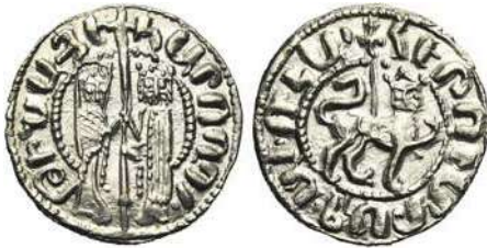
Նկ.6 Հեթում թագավորի արծաթե դրամը

Հեթում թագավորը թողարկել է իր և Ջաբել թագուհու պատկերով արծաթե դրամներ (Նկ. 6): Նրանք պատկերված են կանգնած դիրքով՝ բռնած իրենց միջև գունվող խաչը: Նրանց շուրջը գրված է <<ԿԱՐՈՂՈՒԹԻԻՆՆ ԱՅ Է>>, այսինքն <<կամքն Աստծունն>> է: Դարձերեսին առյուծի պատկեր է, որը դեպի աջ է քայլում և մեջքին ունի խաչ, որի շուրջը գրված է <<ՀԵԹՈՒՄ ԹԱԳԱՎՈՐ ՀԱՅՈՑ>>: Այս դրամները մեզ փոխանցում են մի կարևոր փաստ, ըստ որի Հեթումն, ամուսնանալով Ջաբելի հետ, իրեն թագավոր հռչակեց, բայց դրամի դիմերեսին չնշելով իր անունը՝ որպես թագավոր, և Ջաբելին ներկայացնելով իր կողքին՝ կարծես ցույց է տվել, որ սկզբնական շրջանում պարտադիր է եղել հարգել նրա գահակից լինելը իր հետ 14 :