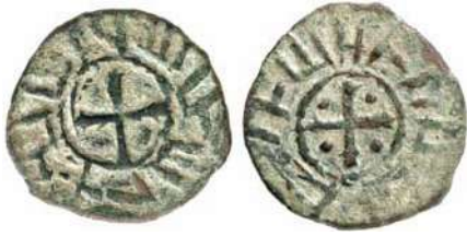
Նկ. 1 Ռուբեն Ա-ի պղնձե դրամը

Պղնձից դրամներ է թողարկել նաև Թորոս Ա իշխանը (1100-1129թթ): Դրամի դիմերեսին պատկերված է հավասարաթև փոքր խաչ՝ եզերված մարգարտաշարով, որի շուրջը հայերենով գրված է <<ԹՈՐՈՍԻ Է ՌԲ>>, իսկ դարձերեսին պատկերված