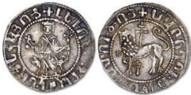
Նկ. 4 Լևոն Ա թագավորի ոսկե դրամը

խորհրդանիշ: Առյուծի պատկերներ հանդիպում են հայկական ժայռապատկերներում որպես արևին ուղեկցող կենդանի: Առյուծի պատկերներն առկա են ուրարտական արվեստում, օրինակ՝ Էրեբունի ամրոցի որմնանկարներում, որտեղ դեպի արև-հավերժությունն ուղղված վեհատես առյուծները պատկերված են երկիր-հայրենին պահելու վճռականությամբ: Հետագայում առյուծը դառնում է Կիլիկիայի հայկական թագավորության զինանշանի, դրամների պատկերագրության անբաժանելի տարրը: 13-րդ դարի վերջի հայ մատենագիր Ներսես Պալիանենցը գրում է, որ Լևոնի թագադրության ժամանակ Սրբազան Հռոմեական կայսրության կայսրը Հայոց նորընծա արքային թագի հետ ուղարկել է նաև անձնական նշան՝ առյուծի պատկերով նշանակ՝ անվանը համապատասխան, քանզի Լևոն առյուծ է նշանակում: Այսպիսով սրանով շարունակվում է Բագրատունի արքաների օրոք սկսված Հայոց թագավորների առյուծանշան շրջանը: Լևոն թագավորը և իր հաջորդները իրենց դրամների վրա շեշտում են Ամենայն հայոց թագավորի տիտղոսը՝ իրենց կապվածությունը ապացուցելով հայրենիքի հետ: