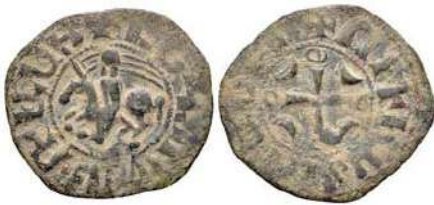
Նկ. 2 Լևոն Բ իշխանի պղնձե դրամը

Կիլիկիայի իշխանական և թագավորական շրջանների դրամներն իրար կապող օղակ է Լևոն Բ իշխանի պղնձե դրամները, որոնք ավելի նրբացված են և գեղեցկացված (Նկ. 2): Դրանց դիմերեսին պատկերված է մարգարտաշարով եզերված ձի հեծած մի ասպետ, որի շուրջը գրված է