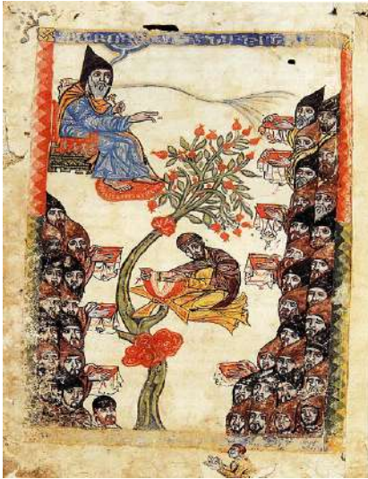
Գրիգոր Մլիճեցի «Սկևռա»

...Կոստանդին Առաջին կաթողիկոսի և արքայական ընտանիքի անդամների պատվերներով նկարագարված ձեռագրերը սքանչելի են իրենց գեղագիտական զգացողությամբ: