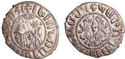
Նկ. 3 Լևոն Ա թագավորի Օծման դրամը

Կիլիկիայի ոսկե դրամները կոչվել են Դահեկան, Դենար, Կարմիր և Ոսկի փող: Արծաթե դրամները՝ Թագվորին, Դրամ, իսկ պղնձե և բիւռնե դրամները՝ Դանգ, միջին չափը՝ Քարտեզ և փոքր չափը՝ Փող 10 :