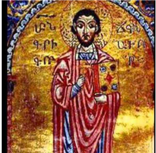
Գրիգոր Մլիճեցի «Մատյան ողբերգության»