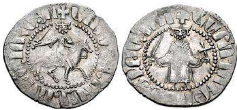
Նկ. 7 Գոստանդին Ա թագավորի արծաթե դրամը

թագավոր: Նրա թողարկած դրամներում նկատելի են գահը գրավելու համար նրա մղած պատերազմների հետքերը (Նկ. 7): Նա Կիլիկիայի միակ թագավորն էր, որ իր դրամներում ներկայանում է սրով և շեշտում Միս քաղաքի տեր դառնալու իր իրավունքը: 15 Դրամի դիմերեսին պատկերված է ձի հեծած թագավորը, որը քայլում է դեպի աջ, թագավորի ձախ ձեռքում ձիու սանձն է, իսկ մյուս ձեռքում՝ սուրը: Դարձերեսին պատկերված է երեք աշտարակներով բերդ, որը հավանաբար Միս բերդն է, շուրջը գրված է <<ՄՍՍՈՅ ԲԵՐԴԻՆ Է ԹԱԳԱՒՈՐ>>, այսինքն <<Միս բերդը թագավորինն է>>: