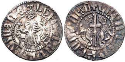
Նկ. 5 Լևոն Ա թագավորի ոսկե դրամը

որպես զարդարանք առատորեն կիրառված է Ռուբինյան զինանշանը: Նրա մեջքին կապած է սուր: Նմանատիպ պատկերագրությամբ մեզ է հասել Լևոն թագավորի 3 դիմանկարներ ձեռագիր մատյաններում, որոնցից երկուսի հեղինակը մանրանկարիչ Թորոս Ռոսլինն է 12 : Դրամի Բ երեսին պատկերված է դեպի ձախ քայլող առյուծ՝ աջ ձեռքով բռնած կրկնաթև խաչ: Առյուծի գլխին թագ կա, իսկ դեմքին նկատելի են մարդկային դիմագծեր: