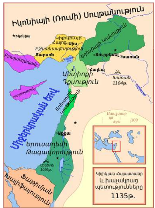
Մերձավոր Արևելքը 1135 թվականին

Նույն թվականին Լևոնին հաջողվեց հետ վերադարձնել կորցված տարածքները պարտության մատնելով Ռայմոնդին: Բյուզանդիայի հարձակման սպառնալիքի պայմաններում, շուտով Լևոնը և Ռայմոնդը հաշտվեցին 4 : 1137 թվականին Բյուզանդիան գրավում է Դաշտային Կիլիկիան, երեսուկոթ օրյա պաշարումից հետո ընկնում է մայրաքաղաք՝ Անարզաբան, Լևոն Ա-ն իր ընտանիքի հետ նահանջում է Վահկա բերդ: Սակայն որոշ ժամանակ անց Լևոն Ա-ն իր կնոջ և որդիներ՝ Թորոսի ու Ռուբենի հետ միասին գերվում է Բյուզանդիայի կողմից և շղթայակապ տեղափոխվում Կոստանդնուպոլիս: